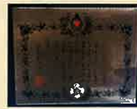
銀色有功章 (個人・法人)