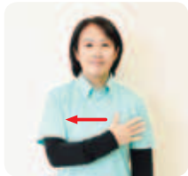
右手を親指から順に折りながら、左から右へ移す