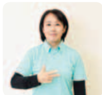
右手の親指、人差し指、中指を立て、甲側を示す