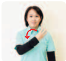
右手の人差し指、中指、薬指を立て、時計回りに回す