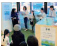
昨年の発表会の様子