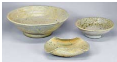
北丘14号窯の灰釉陶器(9世紀末~10世紀初)多治見市教育委員会蔵