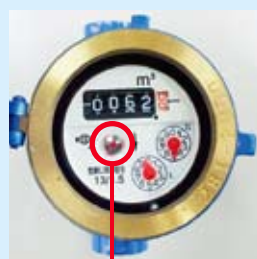
パイロットマーク

パイロットマークが回転していたら漏水の可能性があります。市水道工事指定店に修理を依頼してください。