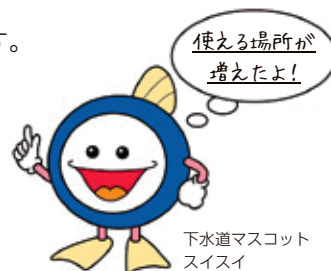
下水道マスコット スライ