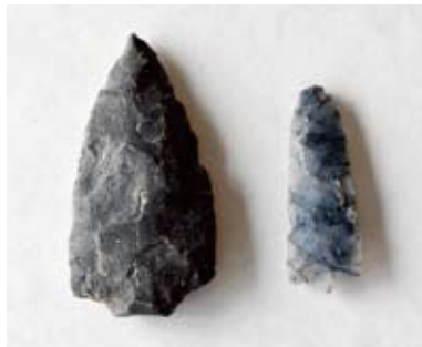
ゆゑつせんとうき 有舌尖頭器(縄文時代の始め頃の石器) 堂上平遺跡・西ヶ洞遺跡(鶴里町) 1万4千~1万2千年前

それ以前の旧石器時代にはなかった煮炊き用の道具「土器」の出現により、人々の暮らしに大きな変革をもたらされました。土器の誕生以前は、肉を焚火で焼くことは可能でしたが、煮込むことはできませんでした。土器により、肉や魚貝を煮込むことが可能になったことに加え、ドングリ類やクズ・ワラビの根など加熱しないと食べられない植物を食料とすることができるようになりました。特にドングリ類はカロリーも高く、長期保存も可能なため、縄文人にとって大切な食糧となりました。こうして食材の幅を広げた縄文人は日本列島全体に広がり、1万年以上もの間、安定した定住生活を営みました。