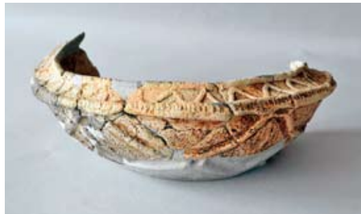
鉢形土器 妻木平遺跡(妻木町) 5千年前頃