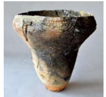
深鉢形土器 入海道遺跡(鶴里町) 5千年前頃