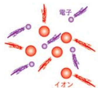
物質の状態を表すプラズマ

ところで、医療や食品の分野でも、「プラズマ」という言葉を耳にすることがあります。例えば、マイコプラズマやプラズマ乳酸菌のように。これらは、私たちの研究しているプラズマとはあまり関係がないようです。