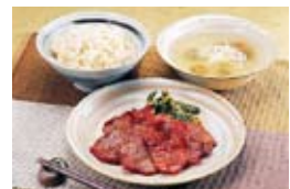
牛たん焼き(宮城県)