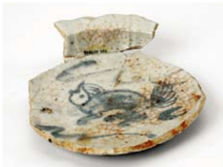
志野麒麟文巾皿 (元屋敷東3号窯 重要文化財)

美濃桃山陶の創成期には黄瀬戸・瀬戸黒・志野が生産されます。黄瀬戸の黄・緑・茶色の色調には、中国華南三彩の影響をみることができ、鉄絵が描かれた志野には中国の染付磁器を写そうとしたものもあります。新しい茶陶の生産を始めた美濃窯において、独自の発展を遂げるそのデザインの一端には中国陶磁の影響もうかがえます。やがて、海外の新しい文化や他の工芸品に影響を受けながら多彩なデザインが生まれ、織部の生産が始まったのです。