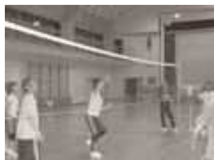
▲スポーツ広場の様子