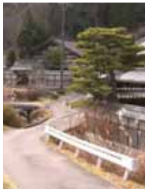
今も残る中馬街道の風景

6月中旬から下旬に は、町内各地でホテル が乱舞する幻想的な光 景が見られます。ぜひ お出掛けください。