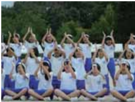
体育大会の団演技の様子

泉中学校では、学校生活のあらゆる場面で「バズ（B u z z）」を行っています。「バズ」とは、小集団での話し合い活動のことです。