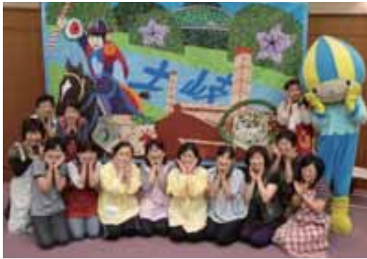
11日のワークショップに参加した皆さんがミナモと記念撮影。