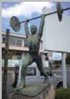
駅前ロータリーの重量挙げ像

岐阜県では47年ぶり、2回目の開催となる第67回国民体育大会(ぎふ清流国体)がいよいよ今年9月から開催されます。本市はウエイトリフティング競技とソフトテニス競技の会場となり、全国から集まる選手たちによる熱い戦いが繰り広げられます。 岐阜県で初めての開催となった第20回国民体育大会(岐阜国体)が行われたのは、昭和40年のことです。本市では大徳原球場で軟式野球競技が、市民センター(現西部体育館)でウエイトリフティング競技が行われました。大会期間中に天皇后両陛下をお招きしたこともあり、記憶に残っている方もいらっしゃるかと思えます。この大会で、岐阜県勢は軟式野球競技で総合3位、ウエイトリフティング競技では総合1位という素晴らしい成績を残しました。 当時、岐阜国体の開催を記念して、西部体育館前には土岐ライオンズクラブより国旗掲揚台が、選手団を迎えた駅前ロータリーには、ウエイトリフティングが土岐市の市技として発展するようにと、土岐青年会議所より重量挙げが寄贈、建立されました。どちらも47年の年月を経てもなお力強く残っており、国体開催へむけた当時の人々の期待と喜びを感じることができます。