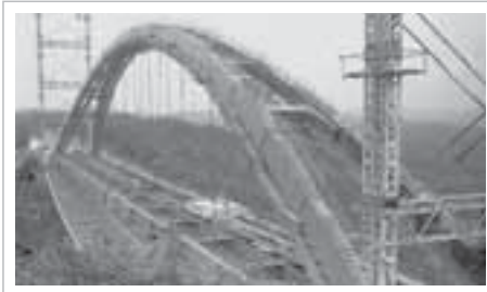
平成3年8月1日号掲載