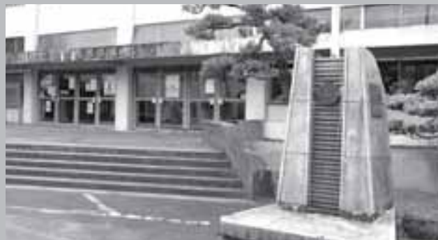
西部体育館前の国旗掲揚台